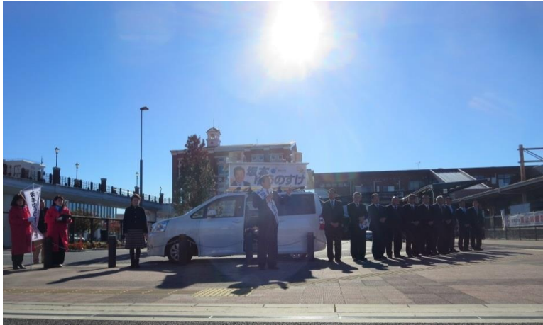
▲ 澄み渡る空の下、出発式！