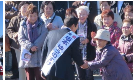
▲ 温かい支援は数えきれない程。▲ 最後まで戦い抜くことが出来ました。