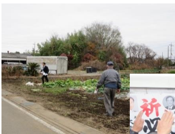
▲ 畑の中も走って訴えさせていただきました。