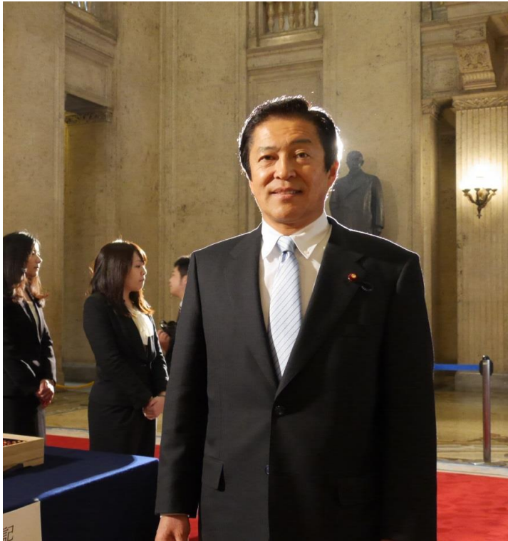
▲ 初登院し、バッジもつけて2期目のスタート！