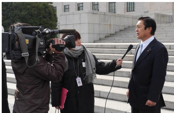
▲ テレビインタビューにて今後の抱負を語る。