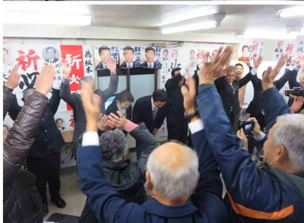
▲ 短期決戦で臨んだ選挙戦。