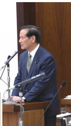
▲ 答弁を行う西川(前)農水大臣。